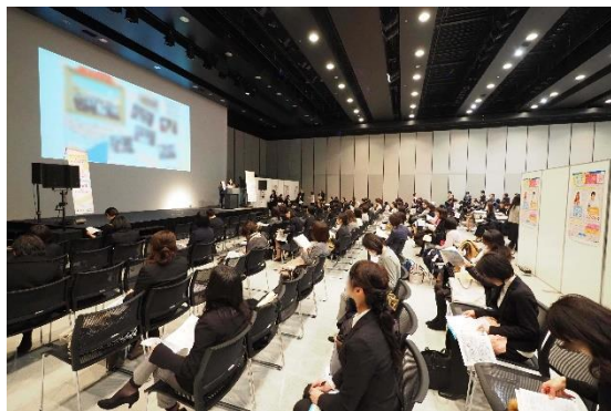
面接会参加企業によるプレゼンテーション